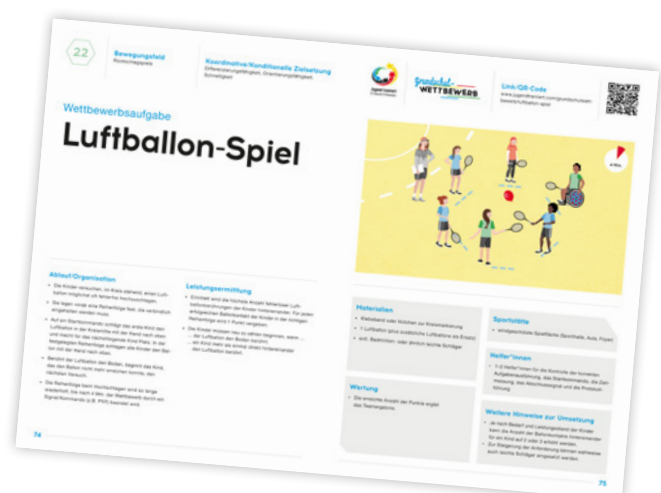
Wettbewerbsaufgabe aus dem Bewegungsfeld Rückschlagspiele

Der „Jugend trainiert“-Grundschulwettbewerb ist ein mehrperspektivisches Sportangebot, das die Teamfähigkeit und Persönlichkeitsentwicklung stärkt, und gleichzeitigsportliche Vergleiche ermöglicht. Alle Wettbewerbsaufgaben berücksichtigen die Diversität in den Klassen und die spezifische Infrastruktur jeder Schule. Sie gestalten ihren schuleigenen Wettbewerb, indem sie aus 52 spielerischen Bewegungseinheiten auswählen.