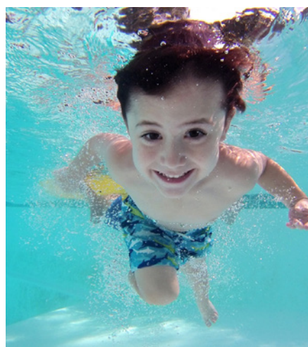
Förderung für Anfängerschwimm-AGs

Die Stiftung Sport in der Schule setzt ihr Programm zur Förderung außerunterrichtlicher Schwimmangebote im Primarbereich und in der Sekundarstufe I im Schuljahr 2024/2025 fort. Es werden Mittel für Anfängerschwimmkurse bereitgestellt, die in Form von außerunterrichtlichen Veranstaltungen (AGs) und in Zusammenarbeit mit einem außerschulischen Partner durchgeführt werden. Pro Kurs stehen 500 Euro zur Verfügung. Insgesamt sollen bis zu 500 Kurse ermöglicht werden.